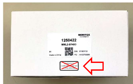
個装梱包への表示例(廃止)