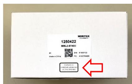
個装梱包への表示例